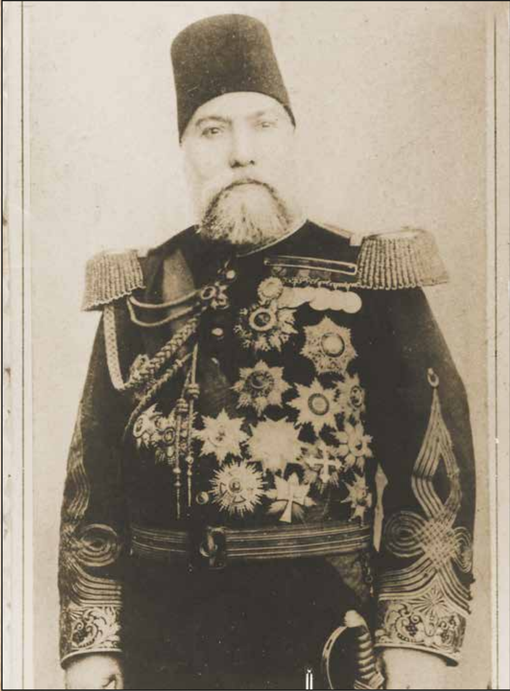
Serasker Müşir Gazi Osman Paşa