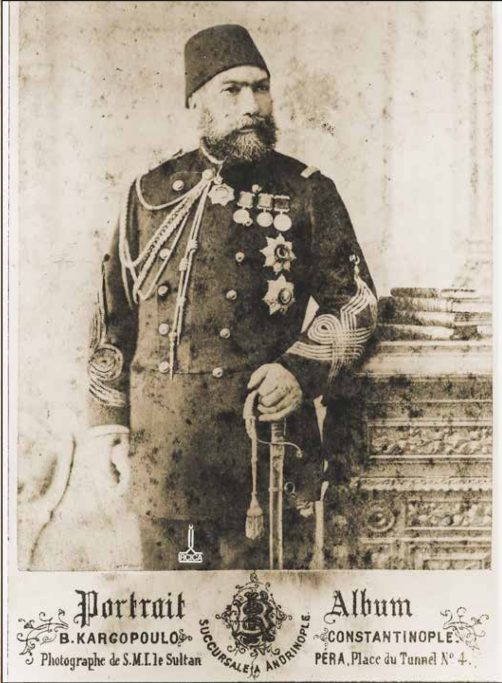
Yaveran-ı Hazret-i Şehriyari'den Mabeyn Müşiri

(Yıldız Koleksiyonu 91282/1) Basile Kargopoulo 1884