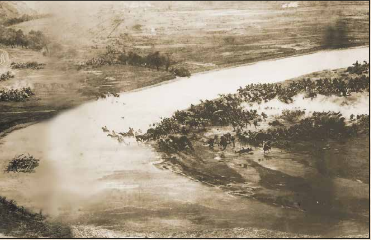
Osmanlı - Rus Harbine Ait Çizimler (Yıldız Koleksiyonu - 90920/4-5) 1877