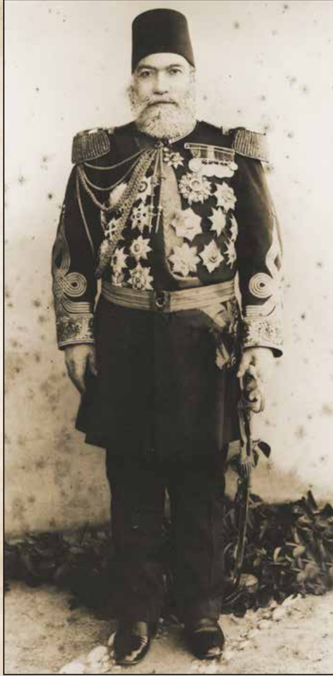
Gazi Osman Nuri Paşa