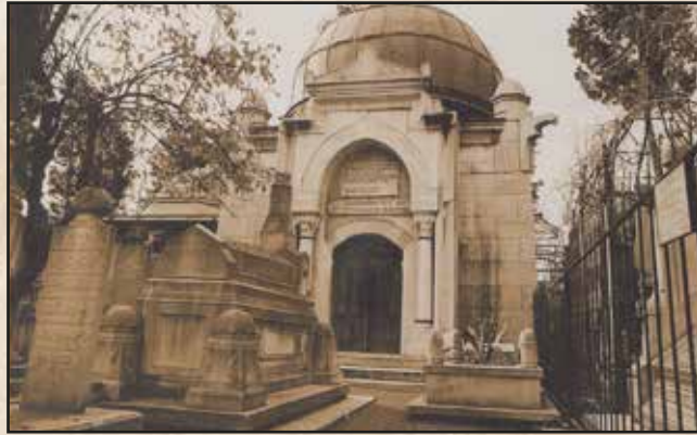
Plevne Kahramanı Gazi Osman Paşa Fatih Camii Avlusundaki Bu Türbede Medfun Bulunuyor

Gazi Osman Paşa'nın cenazesi 5 Nisan günü saat beş sıralarında Beşiktaş Serencebey Yokuşunda bulunan konaklarından, düzenlenen büyük bir törenle kaldırılarak, evvela Beşiktaş'a sonra da İstimbota konulmuş ve 5 adet beşer çifte kayıklarla Unkapanı İskelesine nakledilmiştir. Yine burada düzenlenen fevkalade derecedeki bir cenaze alayı ile yediyi yirmi gece Fatih Camine varılmıştır. Balat'ta bulunan Kadı Saidi Dergahı Postnişini Muhammed Keşfi Efendi tarafından cenaze namazı öncesi duada bulunularak kahramanlıklarından bahsolunmuş, cenaze namazını ise Beşiktaş Yahya Efendi Dergahı Türbedarı Şeyh Abdalî Efendi kıldır-mış ve sonra da Fatih Sultan Mehmet Türbesi yanında hazırlanmış olan hususi yere defnedilmiştir.