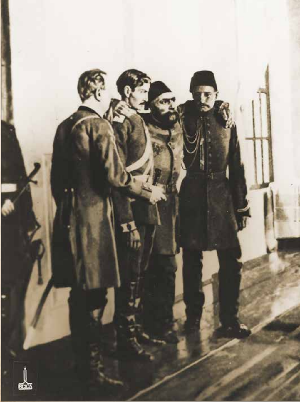
Gazi Osman Paşa Rusya'da Esirken