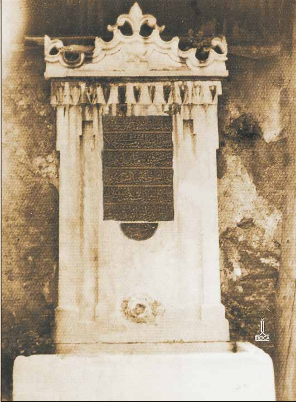
Gazi Osman Paşa'nın Beşiktaş Serencebey'deki Çeşmesi (Edip Özkale Müşirleri Koleksiyonu 13)