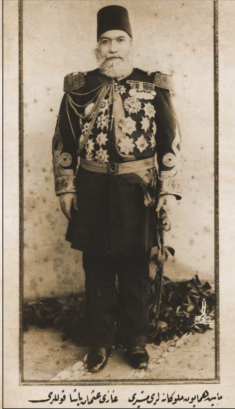
Mabeyn-i Hümayun Mülukaneleri Müşiri Gazi Osman Paşa Kulları

(Yıldız Koleksiyonu-91041/5) Abdullah Freres 1892/1893