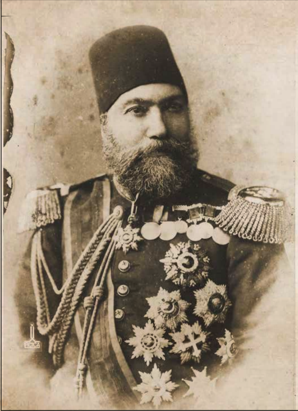
Gazi Osman Paşa