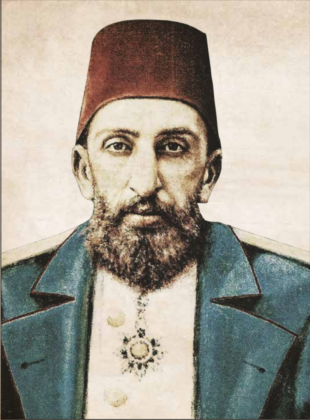
Dönemin Padişahı Sultan II. Abdülhamit Han Hazretleri