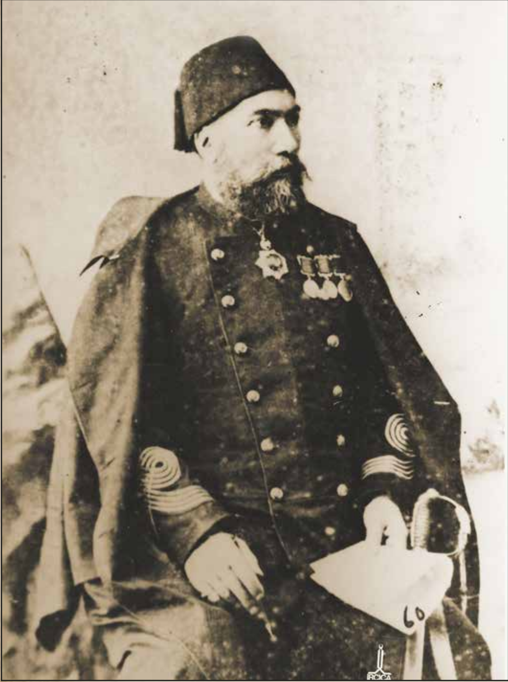
Gazi Osman Paşa