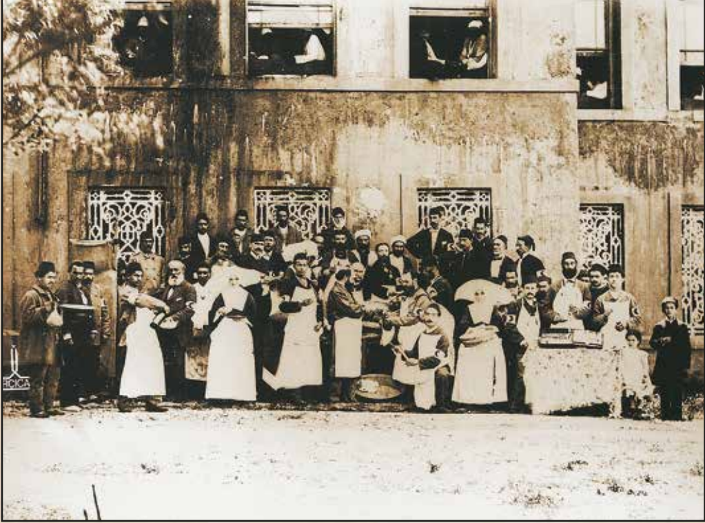
Osmanlı-Rus Savaşında Hilal-i Ahmer Cemiyeti'nin Faaliyetleri, Beylerbeyi Askeri Hastanesi Ağalar dairesindeki Hastalar