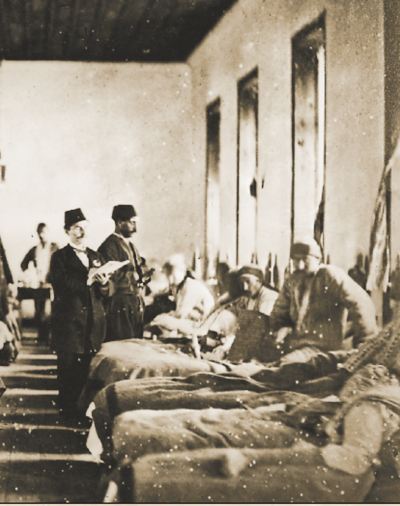
Osmanlı - Rus Savaşında Hilal-ı Ahmer Cemiyeti'nin Faaliyetleri, Selanik'de Hilal-ı Ahmer Cemiyetine Ait Hastahane (Yıldız Koleksiyonu 90667/20) 1877-1878